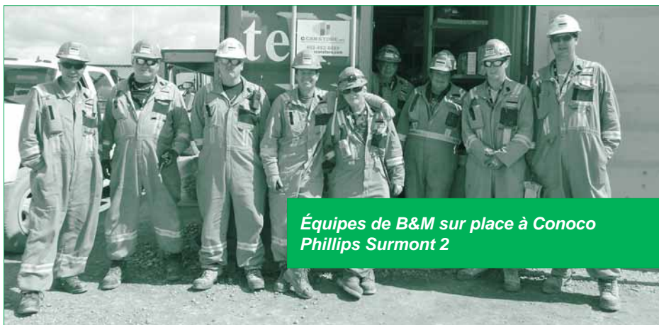
Équipes de B&M sur place à Conoco Phillips Surmont 2

La Région Industriel (Ouest du Canada) est un chef de file en matière de sécurité dans chacun de nos projets, avec plus de 2,5 millions d'heures sans incident avec perte de temps depuis notre fondation en 2012. En respectant diligemment le système de gestion SSE de Black & McDonald et en promouvant une culture solide en matière de sécurité, l'objectif « Pas de blessés, ni aujourd'hui, ni demain » est réalisable.